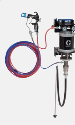
30:1 hava destekli duvara monte