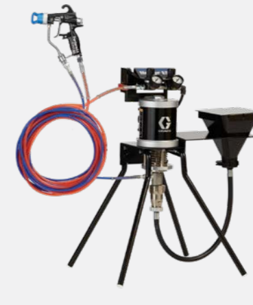
30:1 hava destekli hazneli standa monte