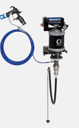
30:1 havasız duvara monte