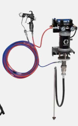
15:1 hava destekli duvara monte