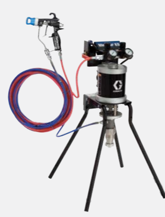
30:1 hava destekli standa monte