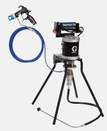
30:1 havasız standa monte