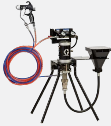
15:1 hava destekli hazneli standa monte