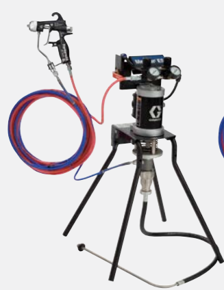
15:1 hava destekli standa monte